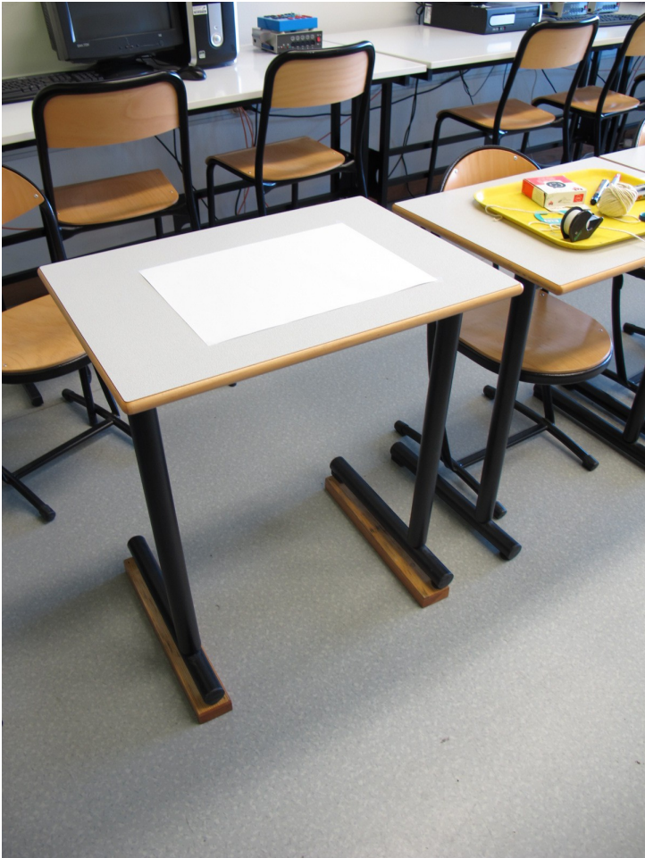
Table de classe surélevée pour avoir une vision panoramique sur la salle de cours ou de TP.