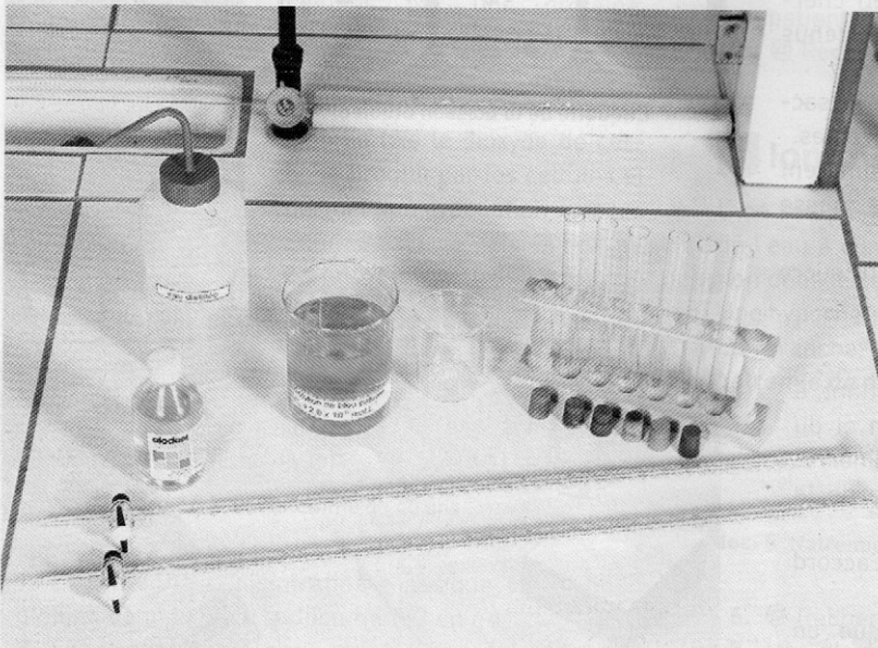
doc. 10 Matériel disponible. La solution mère de bleu patenté dans le bécher est à 2,0 \times 10^{-6} \text{ mol} \cdot \text{L}^{-1} .

Pour cela, le matériel suivant est disponible (doc. 10).