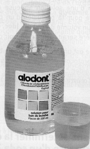
doc. 9 Notice de l'Alodont ® .

Pour cela, le matériel suivant est disponible (doc. 10).