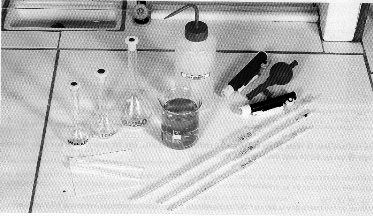
doc. 1 Le matériel à utiliser pour une dilution.

Le volume V_0 de solution mère à prélever se déduit du facteur de dilution : F = \frac{V_f}{V_0} , soit : V_0 = \frac{V_f}{F} ou V_0 = \frac{V_f \times C_f}{C_0} .